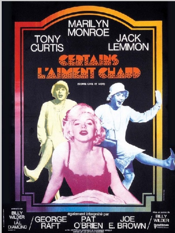
affiche de Jouineau Bourduge