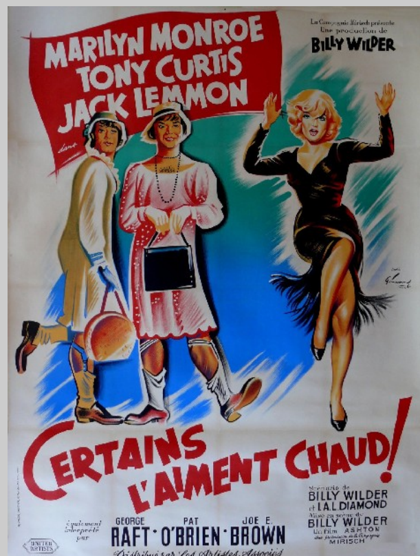
affiche de Boris Grinsson

5. comparer Marilyn dans l'affiche n°1 et dans l'affiche 2.